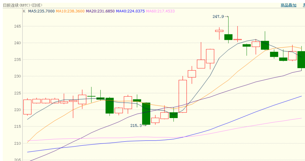
图 2、日胶连续 6 月 12 日行情走势