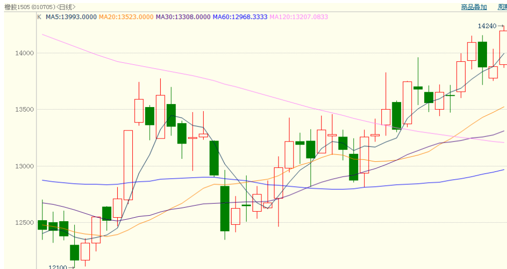
图 1、沪胶 1505 2 月 26 日行情走势