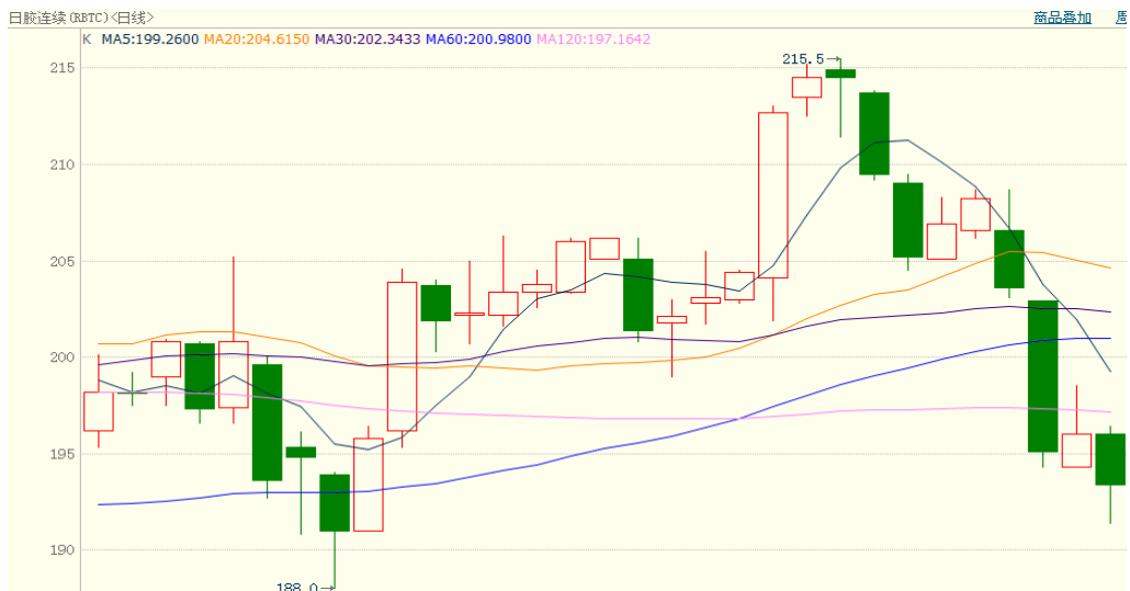
图 2、日胶连续 1 月 16 日行情走势