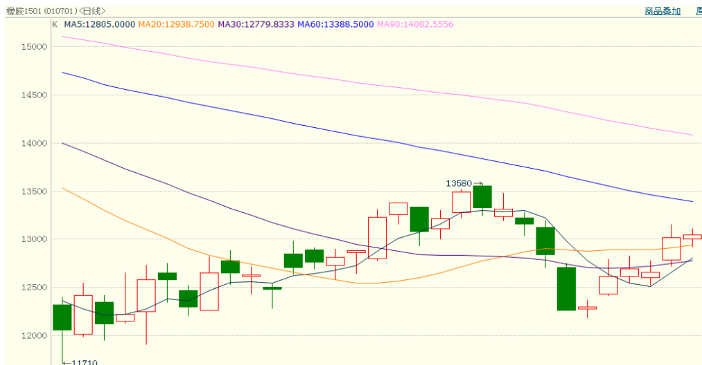
图 1、沪胶 1501 11 月 12 日行情走势