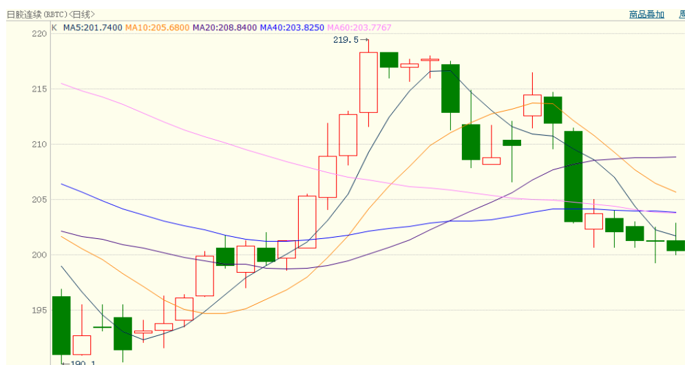
图 2、日胶连续 7 月 14 日行情走势